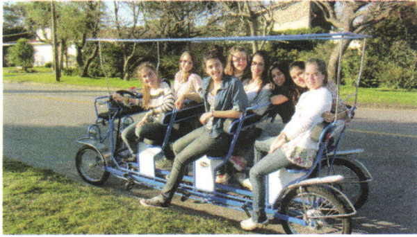
Das Fahrrad für acht Personen.- Mit meiner Gastschwester und Freundinnen.