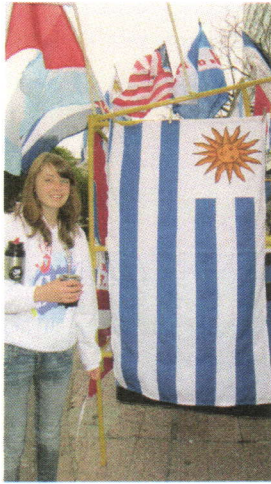
Mit dem Mate