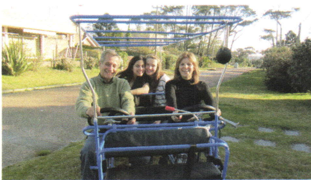
Meine Gastfamilie und ich.