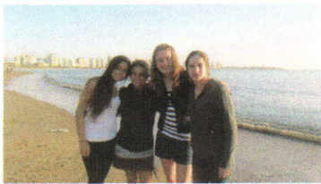
Meine 3 Gastschwester und ich in Punta del Este.