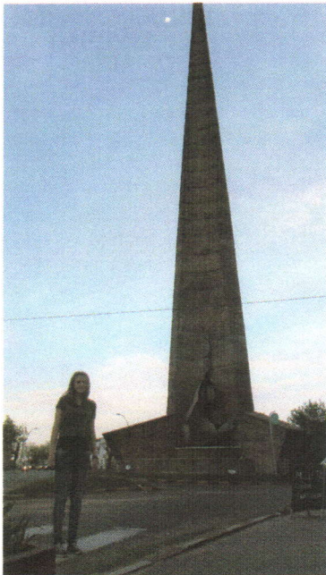
Ich mit dem Wahzeichen der Stadt. -dem Obelisco