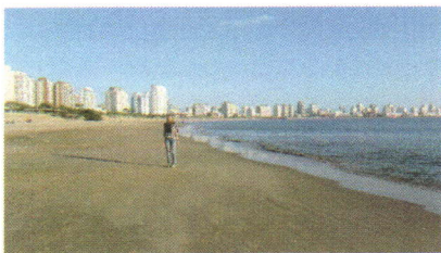
Punta del Este.