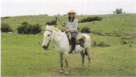
Reiten im Campo.